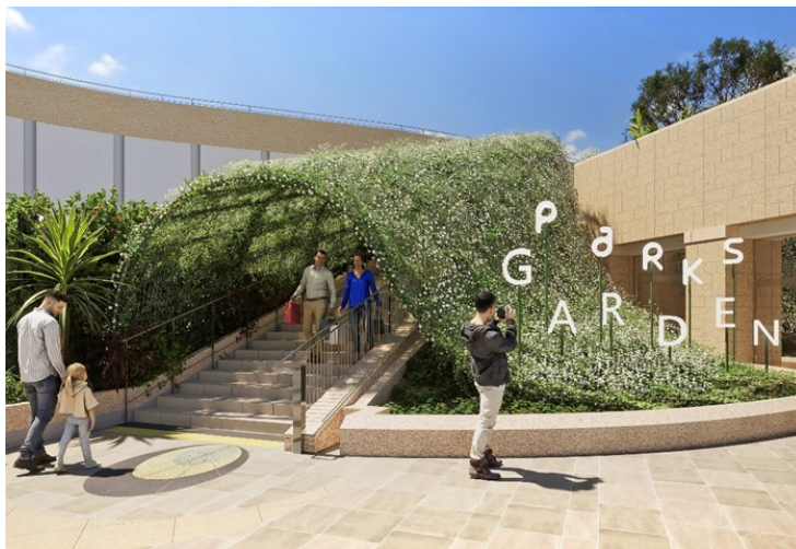
▲ジャスミンが生育した姿

ガーデンへの好奇心を喚起する緑のゲート。巨大な緑の丘が、グランドレベルからのガーデンへの入口としてお客さまを誘います。植物の瑞々しい香り いざな を全身で浴びることができます。長い年月をかけて成長していく植物の生命を表現するような、ジャスミンの生育とともに日々移ろい変わるゲートの姿をお楽しみください。