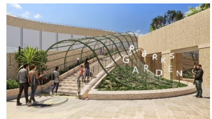
▲リニューアル竣工時の姿(昼)