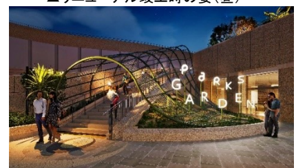
▲リニューアル竣工時の姿(夜)