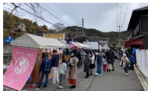
▲第1回めでたい祭の様子