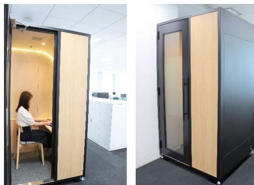
▲1人の業務に集中できるブース