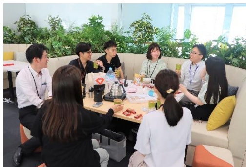
▲【コーヒー会】コーヒー好きが自主的に集まり、就業時間外にコミュニケーションを図っている様子