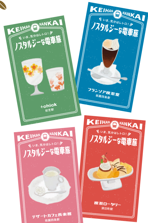
オリジナルステッカーイメージ