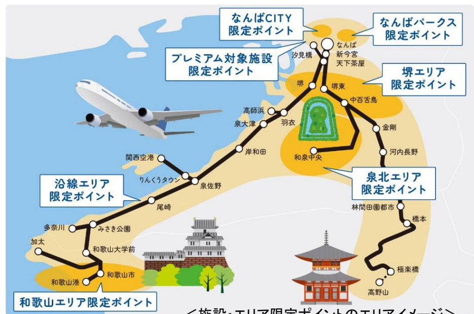
<施設・エリア限定ポイントのエリアイメージ>