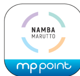
<ポイントアプリ（なんばまるっとアプリ）ロゴ>