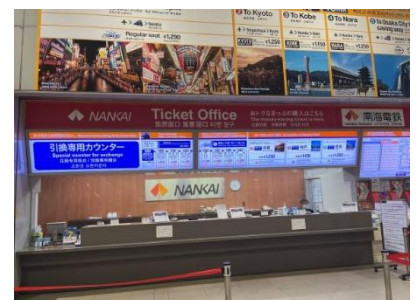
南海チケットオフィス