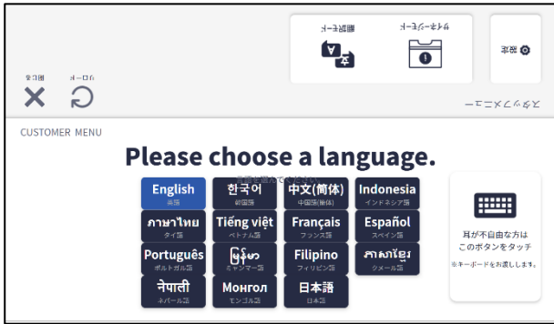
【手順①】 タブレットで言語選択する