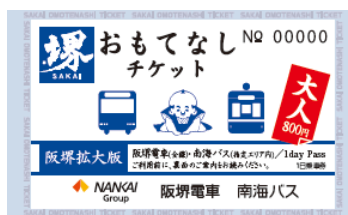
▲堺おもてなしチケット（阪堺拡大版）