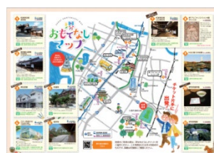
▲堺おもてなしマップ(特典施設掲載)