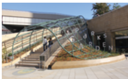
パークスガーデン

さらに2023年11月から2024年4月にかけては、過去最大規模のパークスガーデンリニューアルを実施。人と自然がもっと近づき、五感で自然を感じられる「タッチングネイチャー」をコンセプトとし、鑑賞型にとどまらない屋上公園を目指した。