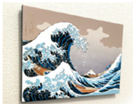
漆芸ウォールパネル

2020年12月には、和歌山県事業承継ネットワーク（現：和歌山県事業承継・引継ぎ支援センター）を主催に加え「南海沿線アトツギソンvol.2 in WAKAYAMA」を開催。同イベントによる初の事業化は、和歌山県海南市で紀州漆器などの製造・販売を行う株式会社山家漆器店が2021年7月30日に発売した「漆芸ウォールパネル」であった。同年9月20日には、大阪市住吉区で大阪銘菓・粟おこしを製造販売する株式会社粟新が、「5種のナッツBAR」と「まるごと黒豆BAR」を商品化した。