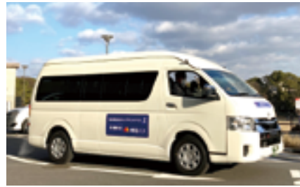
南海オンデマンドバス

たポイントをオンデマンドバスの乗車運賃として利用できるサービスの実証実験も行った。そして2024年10月1日からの第3弾では、ネクスト・モビリティ株式会社とも協力し、運行エリア・実施期間・特典施設をさらに拡充した。