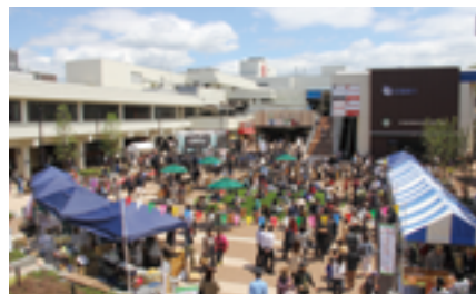
いずみがおか広場