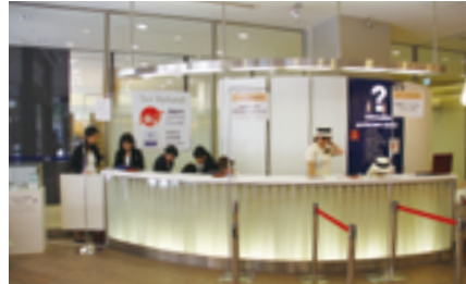
なんばパークス免税カウンター

「なんばCITY」においても、同年10月30日に実施した本館地下2階のリニューアルオープンに伴い、免税カウンターを新設した。