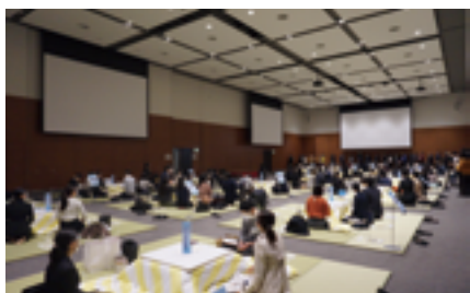
コタツ就活EXPO2022 BY NANKAI

さらに、2021年11月27日には、大阪府や現役大学生によるベンチャー企業CSK株式会社とともに、学生と企業が仮面をつけて互いの素性（企業名・大学名）を明かさずに、「仕事のやりがい」や「働く上で大事にしたいこと」などを語り合う「ミステリー 業界研究 EXPO2023」なども開催した。