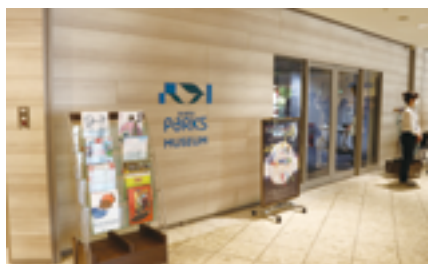
なんばパークスミュージアム

2024年4月19日には、展示・多目的ホール機能を有した「なんばパークスミュージアム」を開業。同ミュージアムは、なんばエリアのエンターテインメントの集積地として、漫画・アニメ・映画・音楽といったポップカルチャーをバラエティ豊かに、感度の高い演出で展示するほか、現代アートなど幅広く本格的なイベントも開催。国内外のお客さまになんばにお越しいただくことで、なん