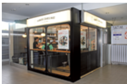
FARMER'S STAND & MART byくらし菜園

地域農家と連携し、スタート時には「夏野菜の女子菜園コース」など3つの農業体験コースを提供。さらに2019（令和元）年8月20日には泉佐野駅にアンテナショップ「FARMER'S STAND & MART byくらし菜園」を開設。沿線農家や事業者と協力し、農の魅力発信拠点として飲食物の提供や沿線商品の販売を行った。