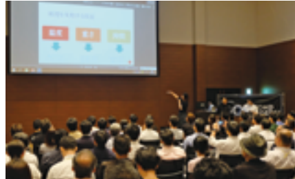
南海沿線アトツギソン

日には会場となった「なんばスカイオ」7階ホールに、南海沿線の中小企業・商店などのアトツギら38人が集まり、一般社団法人ベンチャー型事業承継、大阪府事業承継ネットワーク（現：大阪府事業承継・引継ぎ支援センター）との共催で実施した。