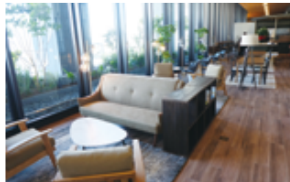
スカイオラウンジ

ニューアルを行い「無印良品」が開業。2階フロアには飲食店を中心に誘致するなど、仕事や暮らしに役立つ「モノ・情報・体験」を提供する施設を目指した。