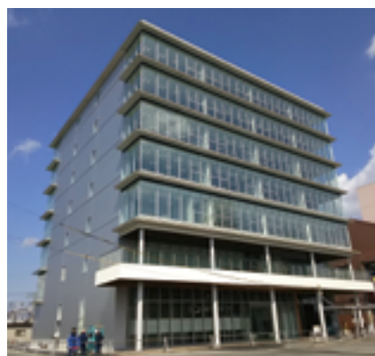
南海和歌山市駅ビル