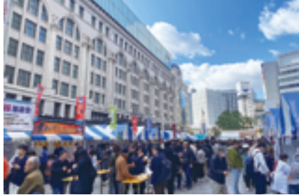
供用開始後初のイベント 「道頓堀リバーフェスティバル」

称：ほこみち区域)」に指定され、民間によるイベント開催が可能に。「なんさん通り(南北区間)」の整備完了をもって事業は2025年3月末で完了した。