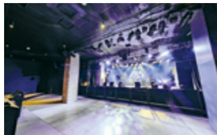
新しくオープンしたライブハウス

2023年9月から、ライブハウス（2店舗）、バイク用品店、会員制シミュレーションゴルフ練習場といった趣味性・独自性の強い個性豊かな4店舗が順次オープンした。中でも、鉄道高架下への「ライブハウス」の入居は珍しく、なんばの新しい