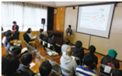
和歌山市で「リノベーションスクール」開催

これらの取り組みをさらに推進させるため、2018（平成30）年10月3日に和歌山市と「リノベーションまちづくり」に関する連携協定を締結。第1弾事業として、同年11月17日に「まちやどシンポジウムー地域や集落の魅力を引き出す『まちやど』の可能性ー」を開催。2020（令和2）年、2022年にはリノベーションを通じた都市再生手法を実践的に学ぶ短期集中型ワークショップ「リノベーションスクール」を開催した。2024年10月には、同スクール卒業生が加太駅前の対象物件を活用し、つけ麺屋「En（エン）」をオープンした。