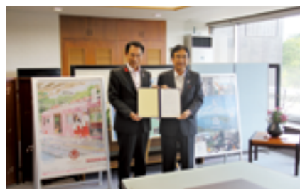
和歌山市と連携協定を締結

和歌山市は、市中心部に増加する遊休不動産を再生・活用し、雇用や産業を創出してエリアの魅力を高める「リノベーションによるまちづくり」を公民連携で進めていた。一方、当社は加太観光協会および磯の浦観光協会と共同で「加太さ