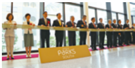
なんばパークス サウス グランドオープン

2020（令和2）年11月に当社、双日株式会社、株式会社日本政策投資銀行の3社は、株式会社ニッピが所有する土地を当社が賃借した上で、なんば開発特定目的会社を設立。大阪市浪速区難波中二丁目におけるオフィスビル開発に着手した。