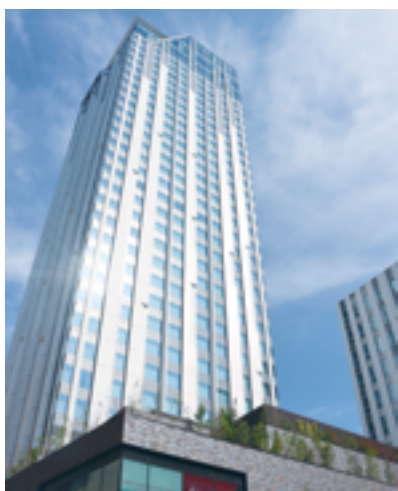
センタラグランドホテル大阪

2023年3月1日、同エリアの名称が「なんばパークス サウス」に決定し、同年3月25日には一部開業、7月1日にグランドオープンした。中核を担うのは、日本初進出となるタイの高級ホテル「センタラグランドホテル大阪」、新オフィス空間「パークス サウス スクエア」、ライフスタイル型ホテル「ホテル京阪 なんば グランデ」の3施設であった。この3施設にわたり展開する「SHOPS & RESTAURANTS」は、「上質なくつろぎ時間と新しい消費体験の提供」をコンセプトとし、14店舗が集結した。