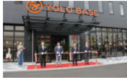
「YOLO BASE」開業記念セレモニーテープカット

者に決定。事業における目的は、オフィス、ゲストハウス、面談や職業訓練の場を整備し、外国人の就労・観光支援の拠点とすることであった。2019(令和元)年9月28日には、当社沿線で事業展開を図る企業などの労働力不足に積極的に対応すべく、宿泊、飲食、イベント機能を備える外国人向けの就労トレーニング施設「YOLO BASE」を開業した。