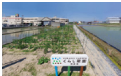
くらし菜園 羽倉崎

2017（平成29）年4月16日に泉佐野市・羽倉崎に体験農園「くらし菜園」を開設した。