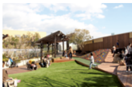
リニューアルしたパークスガーデンの はらっぱ広場

「なんばパークス」は、2017年4月に10周年を迎えるにあたり店舗のリニューアル計画を進め、3月17日にリニューアルオープン。開業当初から追求している「都市で生活を営む洗練された大人の男女」をターゲットとして、国内初出店を含む物販店・飲食店など合計46店舗が新たにオープンした。屋上公園「パークスガーデン」については、開業以来、鑑賞に特化した施設として運営してきたが、同日に初めてリニューアルを行い、屋外バーベキュー施設の設置などにより、体験・参加型の空間へと生まれ変わった。