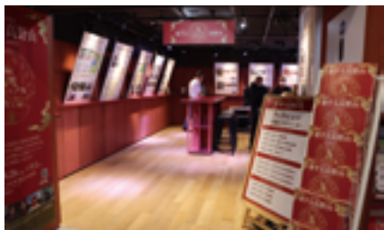
大人の休息 旅する高野山 in Shibuya

さらに2024年は「紀伊山地の霊場と参詣道」が世界遺産に登録されて20周年であり、「こうや花鉄道 天空」の運行開始からも15周年を迎えることから、高野山世界遺産登録20周年特別企画「ふれたい、高野山。2024」を実施した。