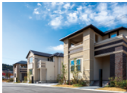
「ソラテラス」外観建物パース

同街区は、自然が豊かでありながら駅から徒歩圏内で、商業施設や教育施設も揃った利便性の高