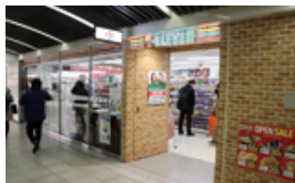
セブン-イレブン・ジャパンとの提携第1号店

1997 (平成9) 年に私鉄3社で始まった「アンスリー」は、その歴史に幕を下ろすこととなった。