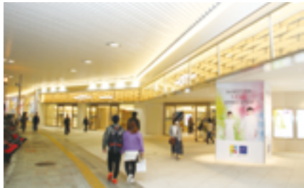
なんばCITY南館1階新エントランス

このリニューアルにおいて、過去最大規模となる、本館・南館あわせて106店舗(新規出店・移転・改装を含む)がオープン。「なんばCITY」は自分らしいスタイルを発見できる、親しみやすさと新鮮さにあふれたショッピングゾーンへと生まれ変わった。