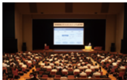
「SENBOKUスマートシティコンソーシアム」 設立総会

2022年6月27日、当社、大阪ガス株式会社、西日本電信電話株式会社（NTT西日本株式会社）および堺市が参画して「SENBOKU スマートシティコンソーシアム」が設立された。目的は、「SENBOKU New Design」および堺市の「堺スマートシティ戦略」の理念などに基づいて、泉北ニュータウン地域ならではの魅力を高めながら持続的に発展し、時代に応じた新たな技術や仕組みを導入してスマートシティ化を実現することにあった。