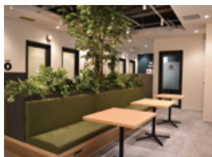
堺東駅前の「Liefdice By NANKAI」

各シェアオフィスでは、web会議などにも対応できるよう鍵付き完全個室ブースを設置。従量課金制での利用や、月額で使い放題の個人プランでの利用が可能であり、多様な利用スタイルに対応している。