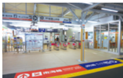
移設後の和歌山市駅改札