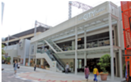
なんばCITY南館に新設されたエスカレーター

新し、開業以来最大の規模となる全面的なリニューアルを実施した。鉄道関連施設の一部を新レストラゾーン(2021年4月には、アウトドア衣料品店にリニューアル)とするほか、「なんばパークス」側に通じる新しいエントランスやエスカレーターを設けることで、両施設間の回遊性を強化した。