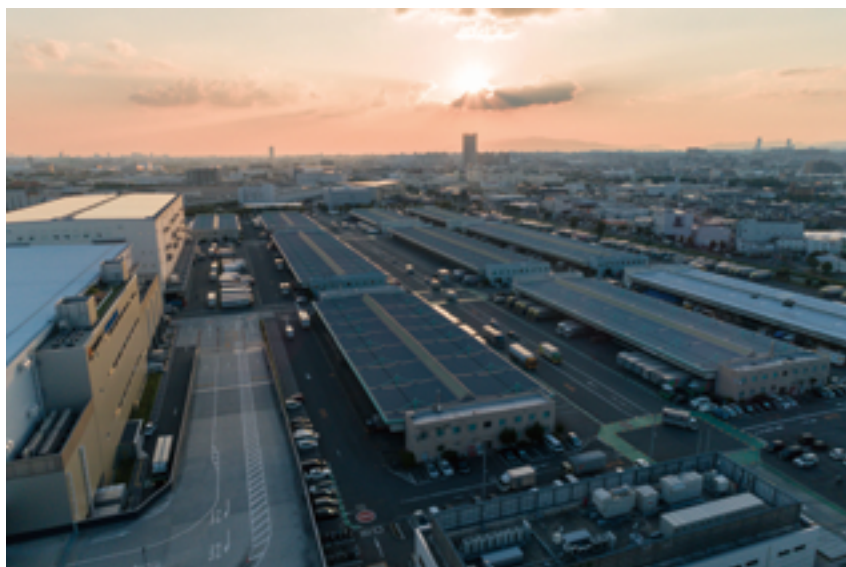
北大阪流通センター