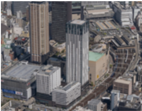
なんばパークス サウス