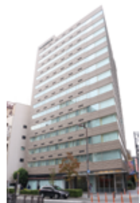
フレイザーレジデンス 南海大阪