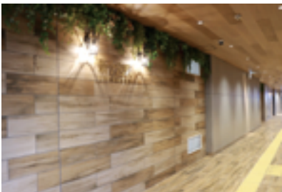
新今宮駅 南北通路