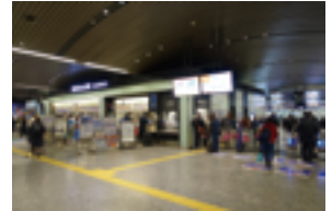
難波駅 3階北改札口