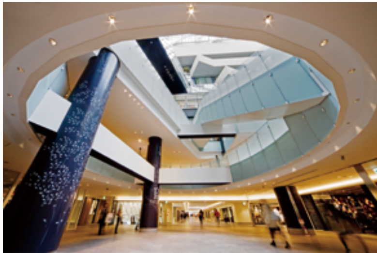
なんば CITY ガレリアコート