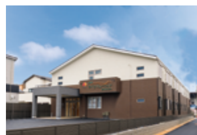
南海ライフリレーション岸和田吉井