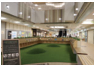
泉ヶ丘ひろば専門店街