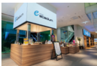
e スタジアムなんば本店