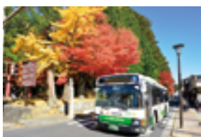
南海りんかんバス