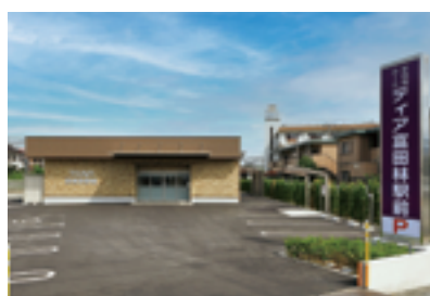
ティア富田林駅前