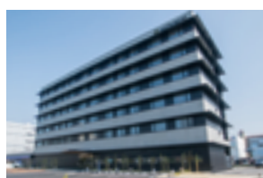
ハタゴイン関西空港