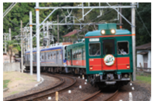
こうや花鉄道 天空