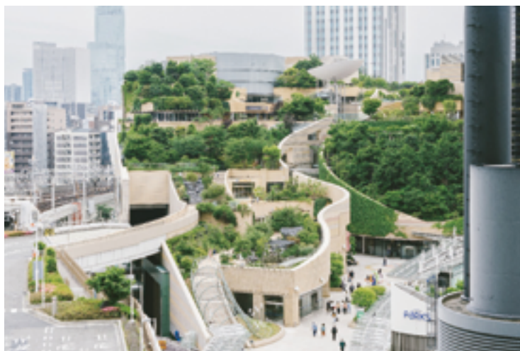
パークスガーデン