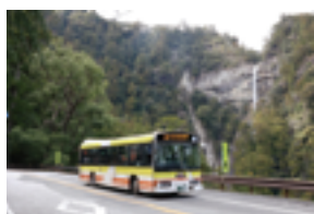
熊野御坊南海バス