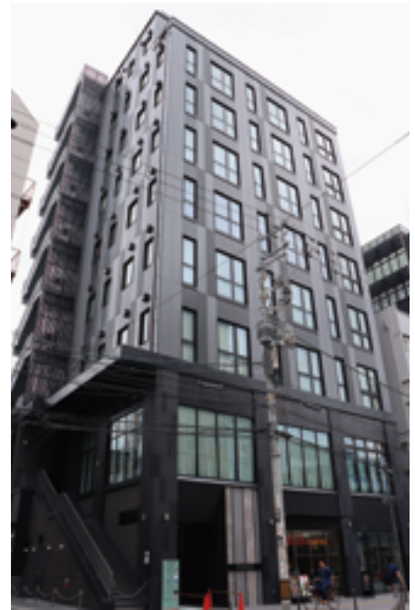
ANA スカイコネクトなんば