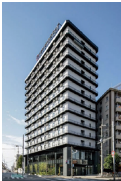
チサンスタンダード 大阪新今宮