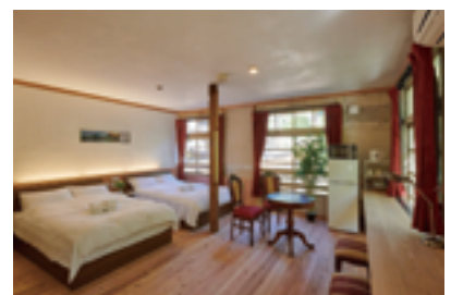
駅舎ホテル「NIPPONIA HOTEL 高野山 参詣鉄道」