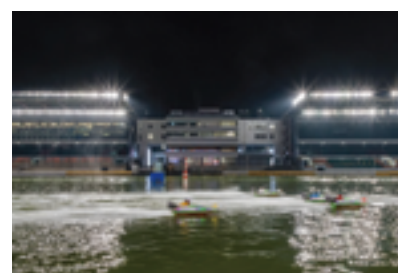
ボートレース住之江