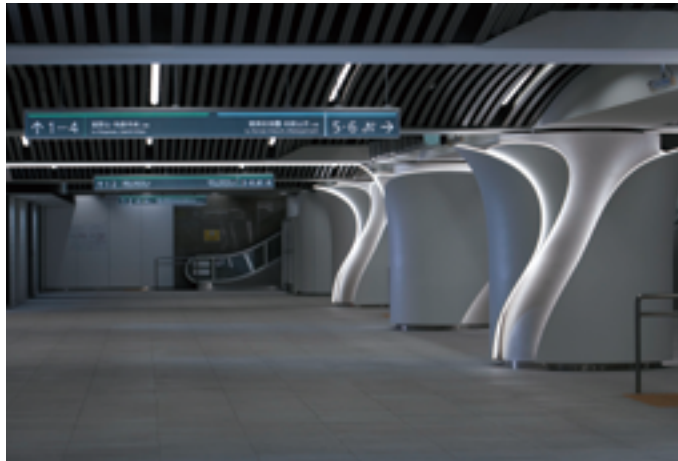
難波駅 2階中央改札口