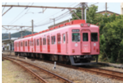
めでたいでんしゃ「さち」