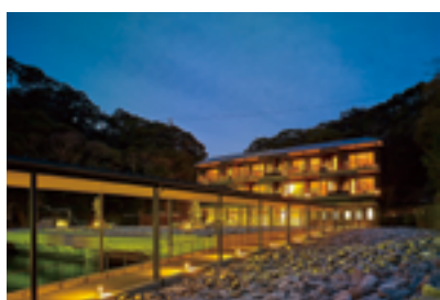
碧き島の宿 熊野別邸 中の島 新館「風の抄」