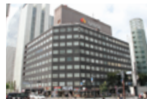
南海東京ビルディング