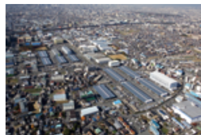
東大阪流通センター