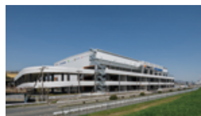
大阪府食品流通センター E棟