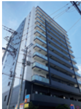
サザンクレストなんば南