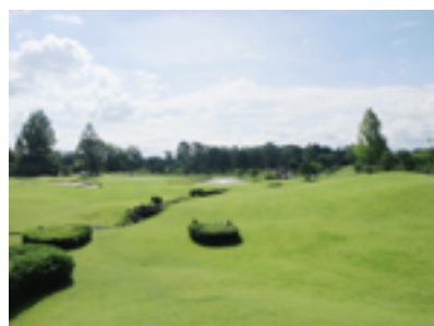
橋本カントリークラブ