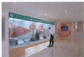
南海ホークスメモリアルギャラリー