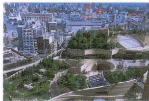
パークスガーデン