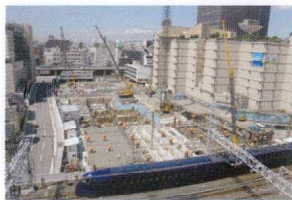
なんばパークス第2期工事

用いただけるよう、お子さまからお年寄りまでをカバーできる店舗構成を考えています。先に申しましたシネマコンプレックスなどもその一つです。