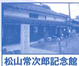
松山常次郎記念館