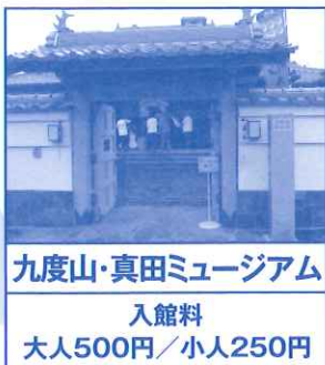
九度山・真田ミュージアム 入館料 大人500円/小人250円