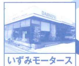
いずみモータース