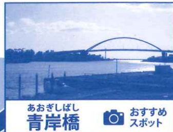
あおしばし 青岸橋 おすすめ スポット

ごみの焼却時に発生する焼却灰や排ガスなどが環境に悪影響を与えることが無いように、様々な設備や薬品を用いてそれらを無害化するように運転しています。