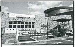
みはら歴史博物館

受付にてこのマップを 提示していただくと 入場料が割引 大人 500円→400円