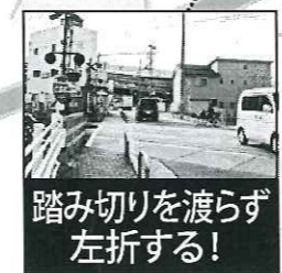
踏み切りを渡らず 左折する!