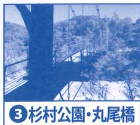
③杉村公園・丸尾橋