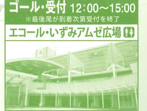
ゴール・受付 12:00~15:00 ※最後尾が到着次第受付を終了 エコール・いずみアムゼ広場