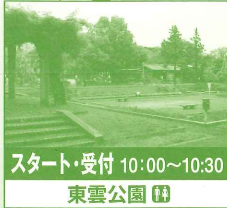
スタート・受付 10:00~10:30 東雲公園