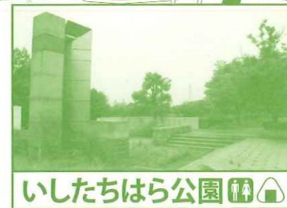
いしたちはら公園