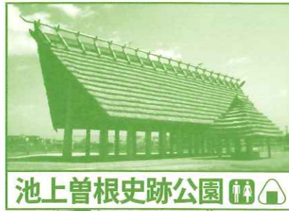
池上曾根史跡公園