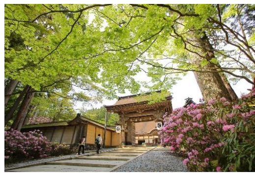
金剛峯寺 新緑