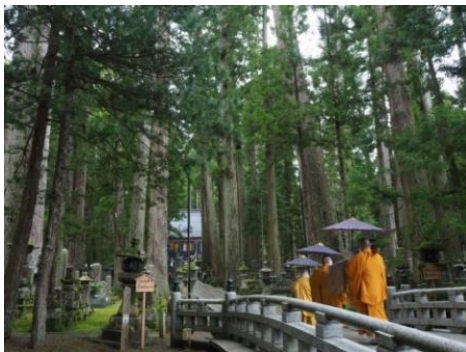
奥之院 しょうじんく 生身供

高速バス「京都高野山線」は直通 約2時間30分 で京都と高野山を結びます。乗り換えが必要な鉄道移動に比べ、お客様の利便性は格段に向上します。