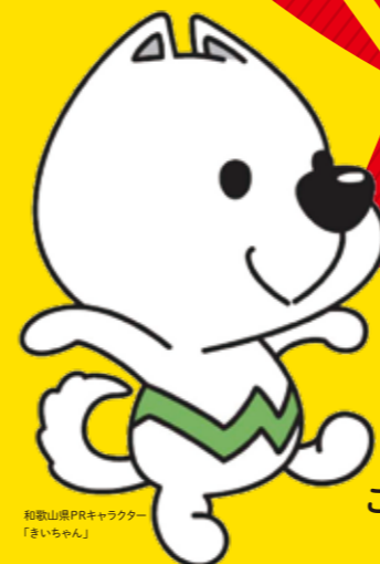
和歌山県PRキャラクター「まいちゃん」