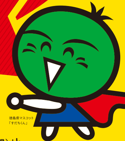
徳島県マスコット「すだちくん」

このキャンペーンは、「和歌山徳島航路需要回復事業補助金(和歌山県)」と「公共交通応援事業奨励金(徳島県)」により実施しています。