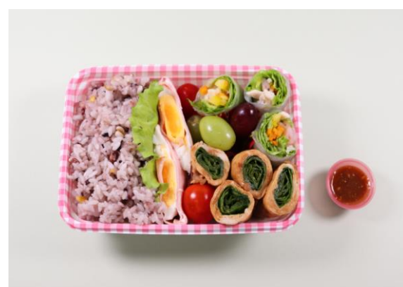
☆府大マルシェ巻きボックス☆