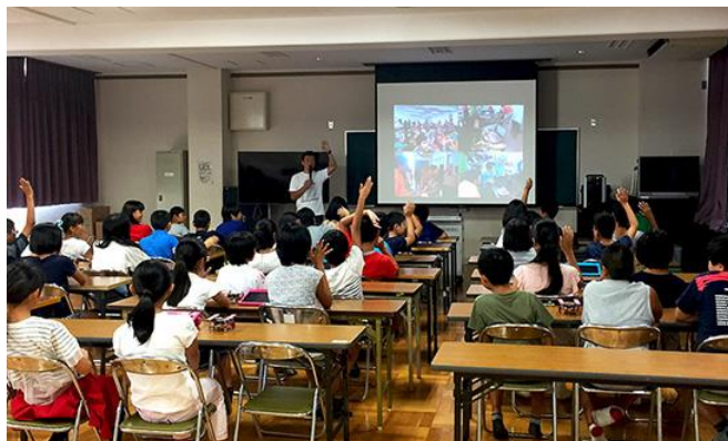
※写真は過去の出前授業の様子です。