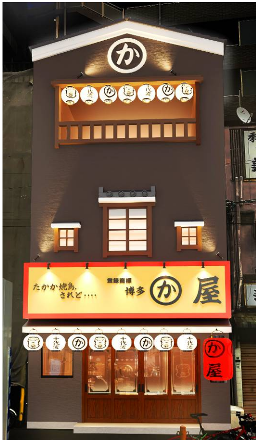
博多かわ屋 京橋南口店（外観イメージ）