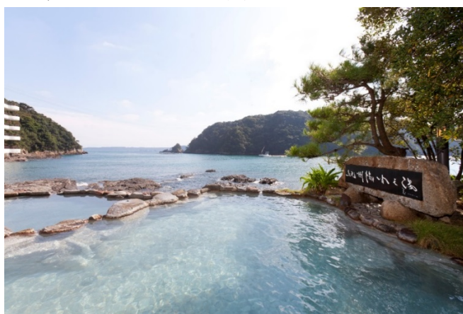
源泉かけ流し天然温泉「 ましゅうちようもんの ゆ 紀州潮聞之湯」