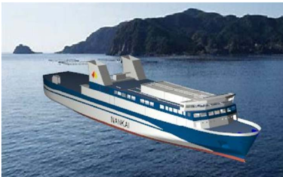
新造船「フェリー あい」（イメージ）