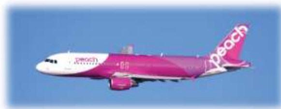
8月1日（水）より 大阪（関空）⇄釧路線を新規就航する 航空会社Peach