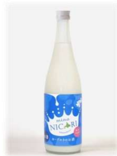
北海道産の牛乳を使用した 日本酒ベースのヨーグルト酒『みなニコリ』 ※お一人さま（720ml）1本付き