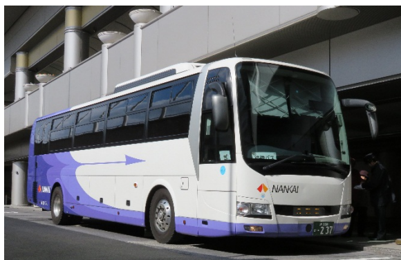
南海バス高松線高速バス

<ご参考>南海バス高松線：大人片道3,900円（なんば～高松）、1日あたり上下計32便