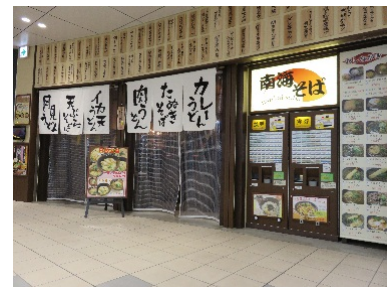
南海そば三国ヶ丘店