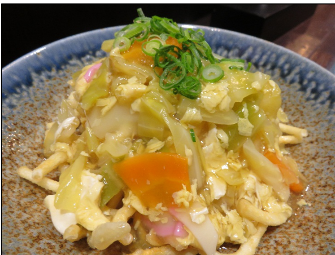
「カリカリあんかけうどん」

今回、南海そばで発売する2種類の“揚げうどん”をきっかけに、関西地域での香川県での認知度をさらに向上させ、大阪から気軽に高速バスを利用したうどん県・香川への誘客を目指します！