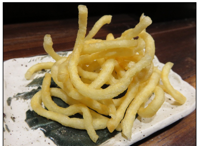
「カリカリ揚げうどん」