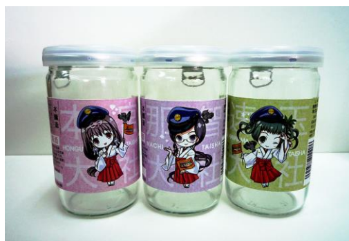
「くまのみこかつぷ」尾崎酒造

熊野の地酒「太平洋」(尾崎酒造株式会社)とコラボレーションを行い、キャラクターラベルの日本酒「くまのみこかつぷ」を販売いたします。中身のお酒は「スローフードジャパン 燗酒コンテスト」で最高金賞を受賞したお酒「太平洋本醸造」で、燗酒だけでなく冷でも美味しく頂けます。販売価格は1個300円(税込)です。熊野交通那智山観光センターなど熊野交通グループ、南海電鉄グループのドライブイン施設などで順次販売しております。