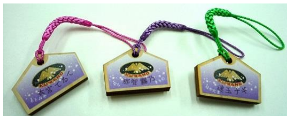
ちび絵馬ストラップ