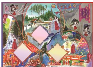
三巫女マップっぷ

熊野三山各社（熊野速玉大社、熊野那智大社、熊野本宮大社）、上記ドライブイン等6か所、熊野交通営業所等（新宮本社、紀伊勝浦駅前出札、志古船舶営業所）、新宮市観光協会、那智勝浦町観光協会、熊野本宮観光協会等