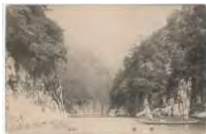
熊野地方最初の絵葉書「瀨峡」

お問い合わせ先：熊野交通株式会社 0735-22-5101 (9:00～18:00)