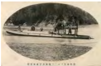
初期のプロペラ船「本宮号」