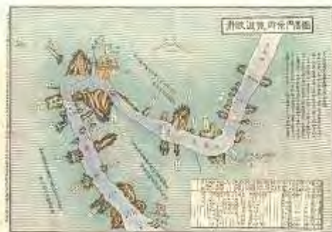
昭和3年発行の瀨峡絵地図