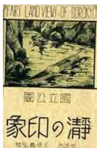
昭和初期の瀨峡の絵葉書セット

「瀨峡探勝プラン」に合わせて、「食堂・喫茶 瀨ホテル」内展示スペースにて、戦前の絵葉書やパンフレット、写真、資料などの実物を展示いたします。モノクロ世界の瀨八丁と当時の瀨ホテル周辺の賑わいぶりや今と変わらない溪谷美をご覧ください。また志古乗船場では川船から飛行艇、ジェット船へと、熊野川交通の変遷をパネルにて展示します。瀨峡の歴史に触れた後、ジェット船にご乗船いただき、瀨峡の今を感じてください。