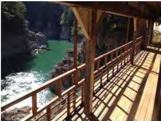
瀨ホテルからの瀨峡溪谷