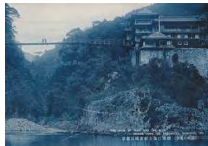
昭和初期の瀨ホテルを写した絵葉書