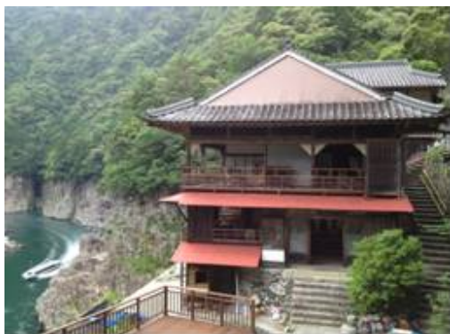
瀨峡にたたずむ瀨ホテル

<内 容> 期間、人数、乗船便限定にて特別料金のセットプランを提供します 「瀨峡ウォータージェット船料金」＋「瀨ホテル喫茶セット」＋ 「瀨ホテル作成の昭和3年の瀨峡絵地図（複製）」 大人3,900円、子供2,300円（共に税込） ※詳細は別紙参照