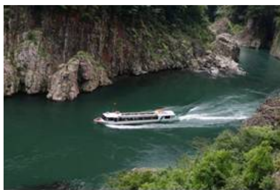
瀨峡ウォータージェット船

お問い合わせ先：熊野交通株式会社 0735-22-5101 (9:00～18:00)