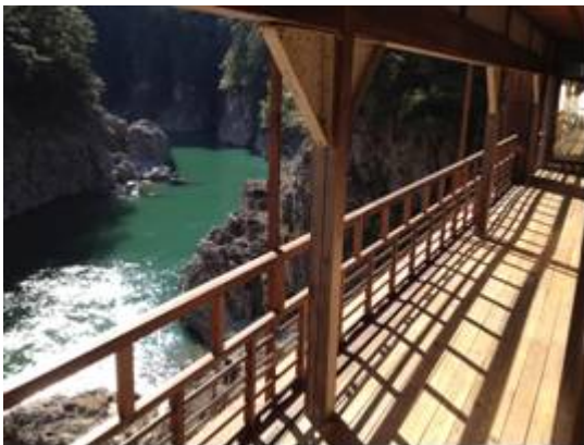
瀨ホテルからの瀨峡溪谷