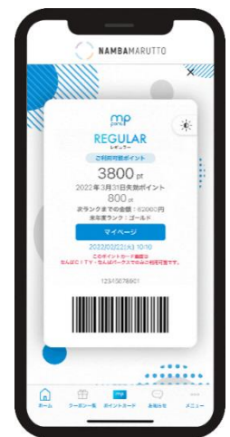
ポイントカード画面(イメージ)