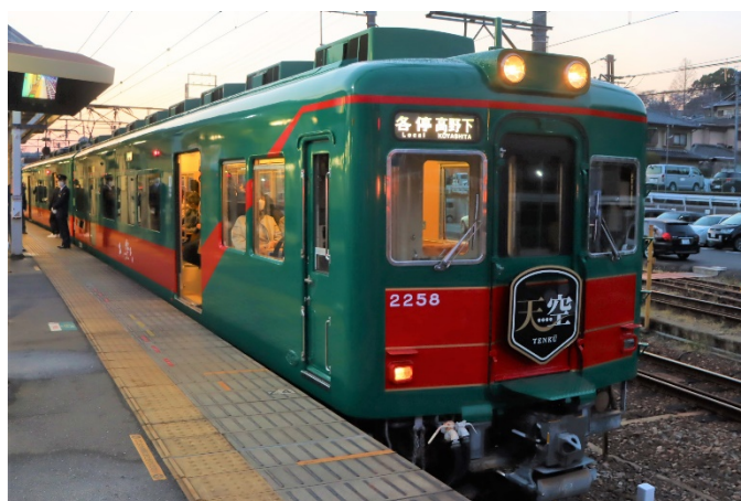
【昨年】減多に見ることができない「各停 高野下行き」の「こうや花鉄道 天空」