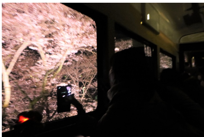
【昨年】車内を消灯し、「こうや花鉄道 天空」から夜桜を撮影している様子