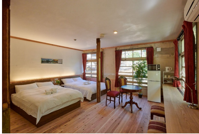
※写真: 駅舎ホテル「NIPPONIA HOTEL 高野山 参詣鉄道 Operated by KIRINJI」の部屋「高野」