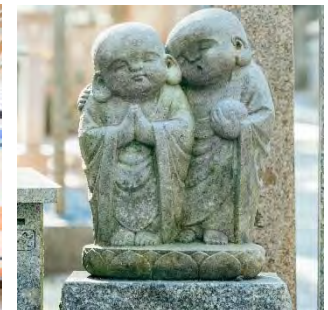
投稿作品イメージ