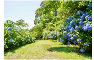
加太アジサイ園 Hydrangea Park

※「HYDE サザン」模型: 縮尺 1/150 4両編成(1両 135mm) W670mm×D60mm×H50mm (連結部および固定台の長さ含む)