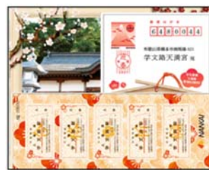
販売時のパッケージ

菅原道真公がこよなく愛したといわれる梅をあしらった美しいデザインの入場券となっています。 1枚ずつ文字が入っており、5枚セットで並べると「合格🍀祈願」になります。