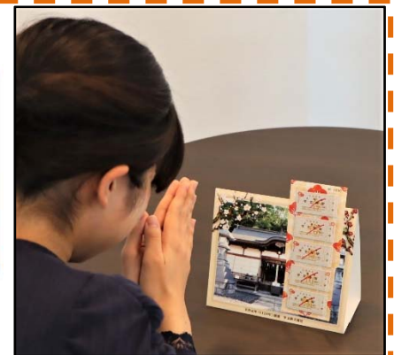
組み立てイメージ