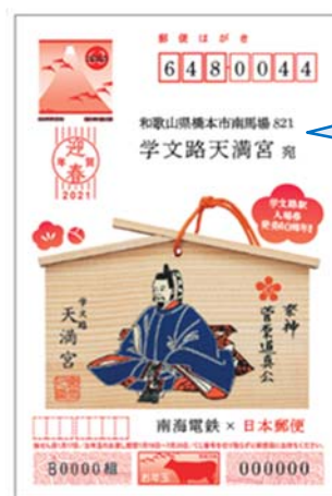
絵馬入り年賀状(表面)

学文路天満宮の写真入りで、組み立てて机などに置くことができます。 コロナ禍で現地に赴くことが難しい学生の皆さまは、ご自身の勉強机に置いて、願いを込めてみてください。