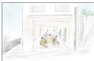
「シェアハウス with おせっかい食堂」