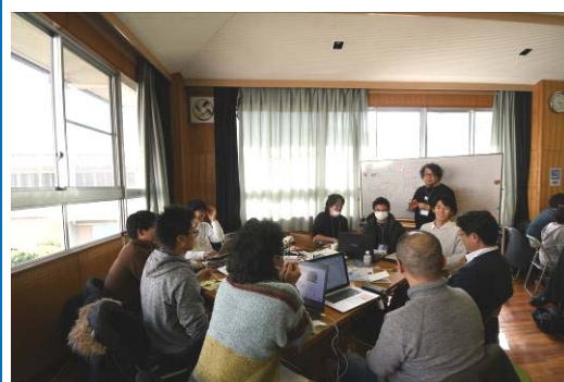
昨年度開催の 「リノベーションスクール@加太」の様子

同スクールでは、参加者が「ユニット」と呼ばれるチームを組み、実際の遊休不動産を対象に、リノベーションまちづくりの先駆者によるレクチャーやアドバイスを受けながらリノベーション事業計画を作成します。最終日には、所有者に対して公開プレゼンテーションで提案を行います。同スクール終了後には、提案内容のブラッシュアップを重ね、事業化を目指していきます。