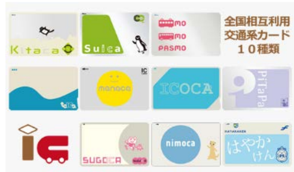
交通系 IC カードでのご購入が可能に

南海グループでは、SDGs への取組みを強化しており、関連するニュースリリースに「SDGs の目標アイコン」を明示しています。今回ご案内の取組みは、3 番、10 番に繋がるものです。