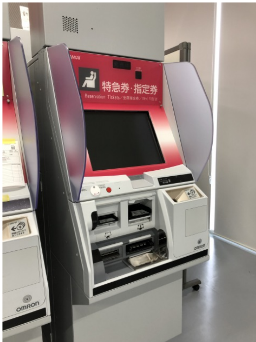
特急券・座席指定券自動販売機 (イメージ)