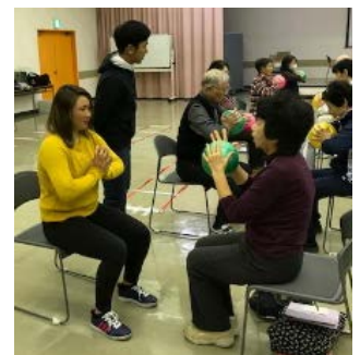
ボールを使った筋トレ