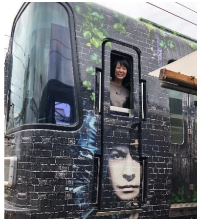
「HYDE サザン」撮影会イメージ