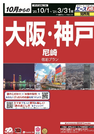
「エースJT B」パンフレット表紙