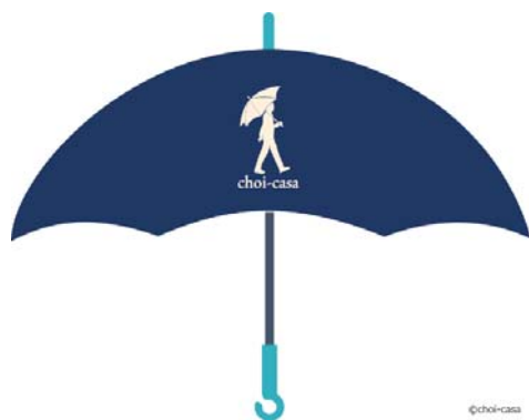
チョイカサ専用傘

なお「チョイカサ」は、本件実施によりまして、大阪市内での利用需要をはじめ、大阪を訪れる旅行者の利用需要を測定するなどしてさらなる検証を進め、本格的な事業化を目指してまいります。詳細は別紙のとおりです。