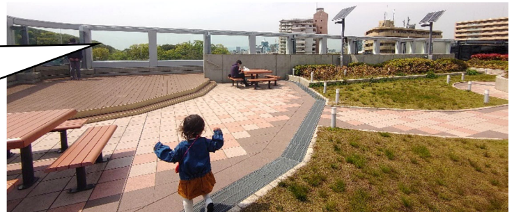
みくにん広場 全景