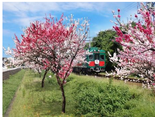
「花桃の郷」の見ごろ(イメージ)