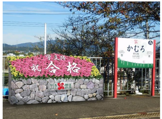
学文路駅上りホーム 「学文路 花文字花壇」設置イメージ