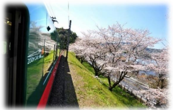
「天空」の車窓から見た桜並木

(5)備考 ・桜の開花状況により、予告なく夜間ライトアップを終了する場合があります。 ・桜の花びらを日中と同じ色で再現できる桜ライトアップ専用LED(40基)を使用します。