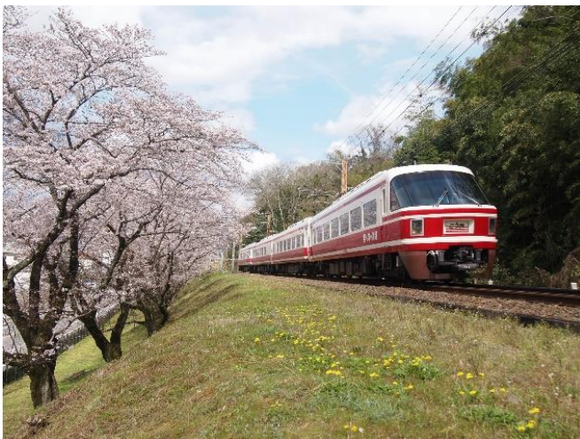
学文路～九度山駅間 桜並木

また、学文路駅上りホームに「学文路 花文字花壇」を3月31日(火)に設置します。 詳細は、別紙のとおりです。