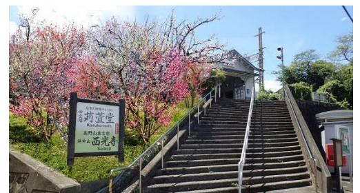
「梅の木」の見ごろ(イメージ)

学文路駅は、1924年11月開業。木造の駅舎は、当時の姿をとどめる趣きある佇まいで「近代化産業遺産」に登録されており、この駅舎と駅前階段の景観を活用するべく、受験シーズンに咲く「梅の木(12本)」を植栽します。植え付けた「梅の木」は、来年2月上旬～中旬に見ごろを迎える予定です。