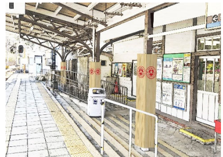
デザインイメージ (加太駅)