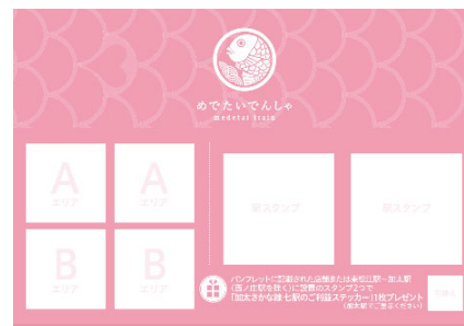
「めでたいバル2020」スタンプ台紙