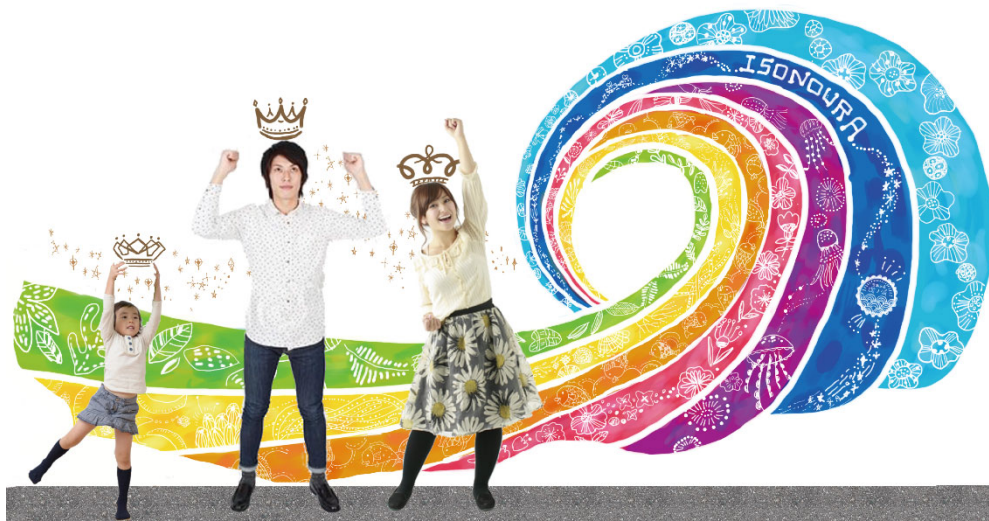
デザインイメージ