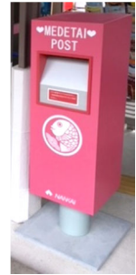
めでたいポスト (加太駅設置デザイン)