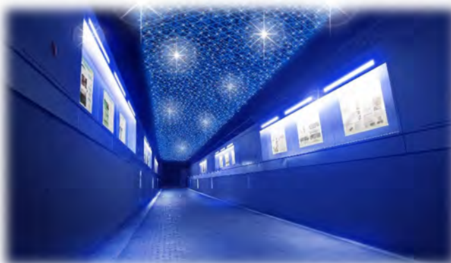
通路全体を幻想的な空間に装飾(イメージ)