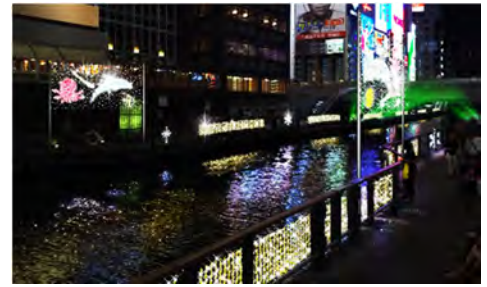
戎橋周辺のイルミネーション（イメージ）