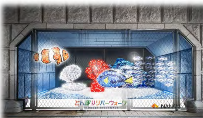
人感センサーで人が通るタイミングで点灯(イメージ)