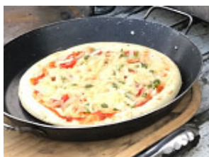
クワトロフォルマッジ