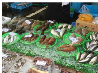
新鮮な魚介や野菜の販売(イメージ)

大阪湾で水揚げされた新鮮な魚介類や収穫されたばかりの野菜などを販売。また、店長おすすめの一品が登場します。