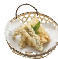
名物 アナゴの天ぷら