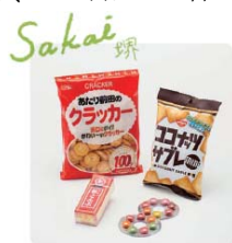
河中堂 堺橋かし銘菓 詰め合わせ