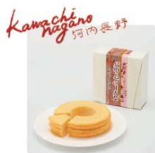
西條合資会社 天野酒パウムクーヘン