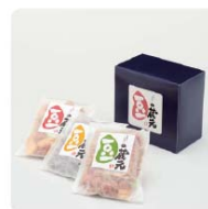
豆の蔵元 3袋セット