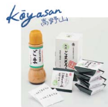
角濱ごまとうふ総本舗 ごまドレッシング 開創ごまとうふ5個入り(たれ付き)