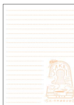
メモ帳イメージ (百舌鳥古墳群エリア)