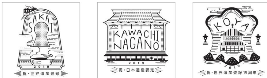
スタンプデザインイメージ