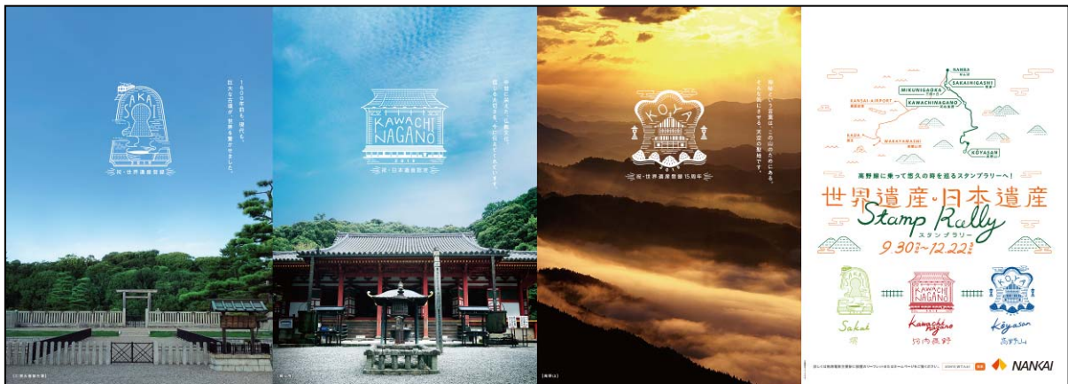
ポスターイメージ（車内吊り）