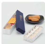
丸市菓子舗 包丁ぼうろ、利休古印