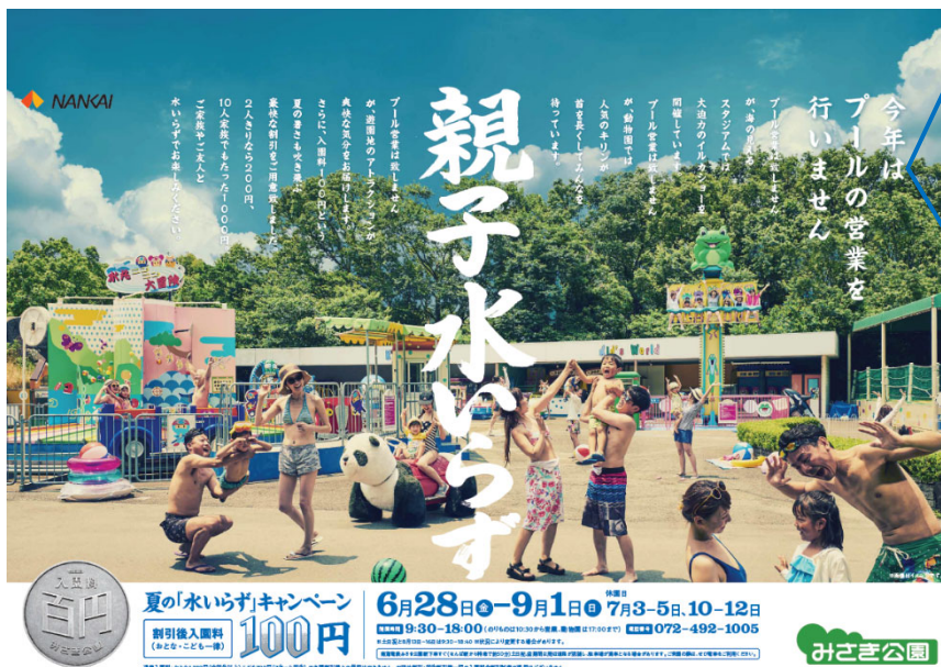
ポスタービジュアル