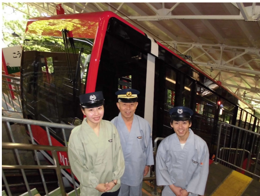
作務衣姿の駅係員と新型ケーブルカーがお待ちしています