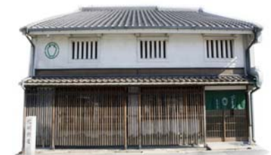
茶寮つぼ市製茶本舗 堺本館（正面）

1990年、全国茶審査技術競技大会において全国3位、茶鑑定士六段認定。2009年、同社5代目代表取締役に就任。2013年11月、茶寮つぼ市製茶本舗 堺本館を九間町に開業。