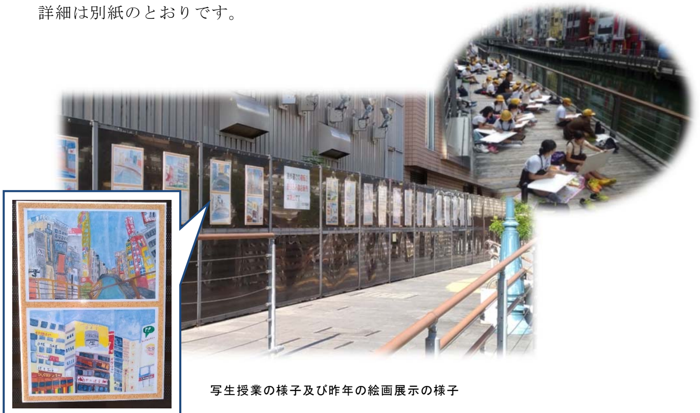
写生授業の様子及び昨年の絵画展示の様子