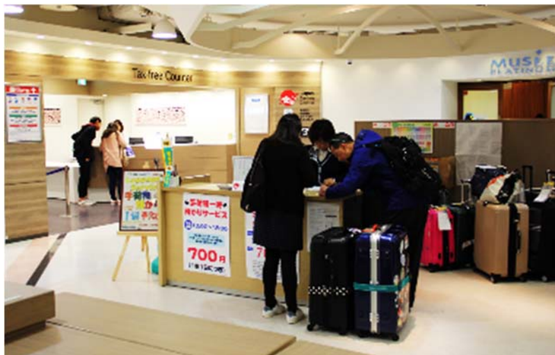
なんばCITY地下2階 宅急便カウンター

南海電鉄とヤマト運輸は、平成28年9月から難波駅直結の商業施設「なんばCITY」地下2階で手荷物一時預かりサービスを行っています。nest 開業後も引き続き営業いたしますので、こちらもぜひご利用ください。