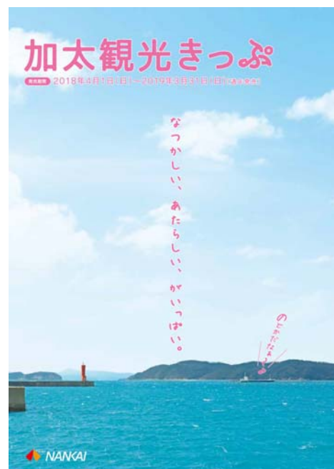
パンフレット表紙（左：和歌山観光きっぷ、右：加太観光きっぷ）