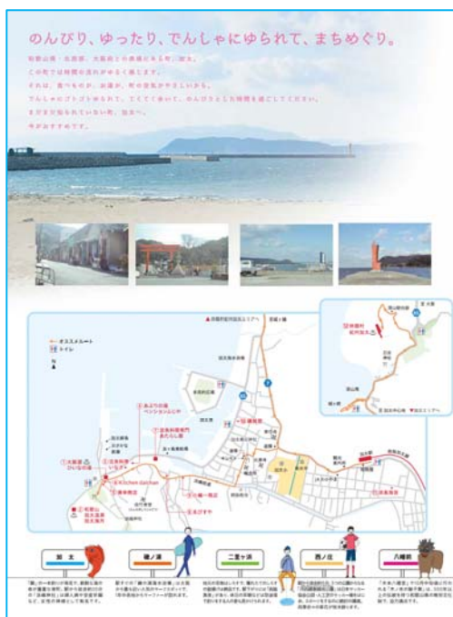
加太観光きっぷパンフレット