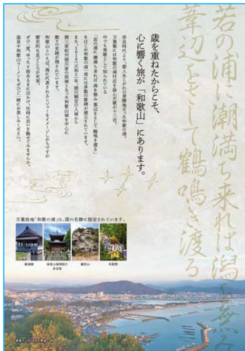
和歌山観光きっぷパンフレット