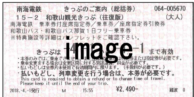
往復版総括券イメージ